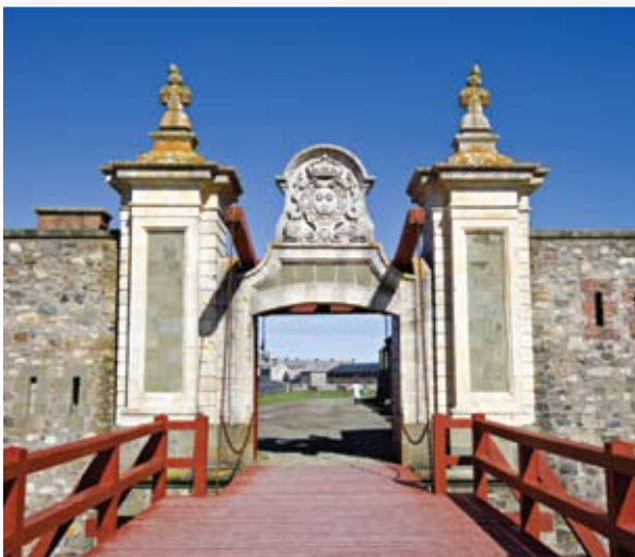
Jour 5 • Nouvelle-Écosse: Forteresse de Louisbourg

Jour 11 Fredericton • Québec • Montréal • Petit déjeuner. Route du retour vers le Québec. Arrêt à Hartland pour y voir le pont couvert. Visite du Parc des Chutes de Grand Sault. Dîner libre. Souper libre. Arrivée en soirée.